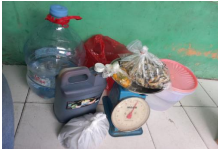
Gambar 4. Bahan dan alat untuk membuat ecoenzym

Pelatihan dilakukan dengan mendemonstrasikan pembuatan eco enzyme melalui pemanfaatan sampah sayuran dan kulit buah-buahan. Demonstrasi bertujuan memperlihatkan secara langsung teknik pembuatan eco enzyme . Beberapa alat dan perlengkapan ditunjukkan beserta tahapan pelaksanaannya. Bahan dan alat yang diperlukan untuk membuat ecoenzym adalah gula, air dan sisa sayuran dan buah-buahan. Ketiga bahan dicampur dan dilarutkan dengan rumus perbandingan 1:10:3, yakni 1 bagian gula, 10 bagian air dan 3 bagian sisa sayur dan buah-buahan. Jadi kalau untuk volume wadah 10L, maka bagian gula adalah 600gram, air 6L, serta sisa sayur dan buah 1800 gram. Ketiga bahan dicampur dan difermentasi dalam waktu 3 bulan.