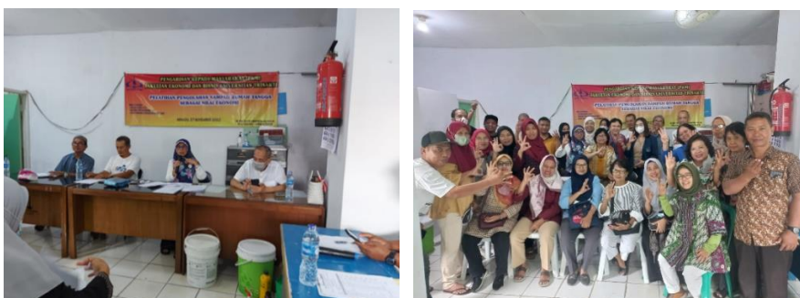
Gambar 3. Kegiatan PkM

Penyuluhan dan pelatihan diberikan oleh Tim Dosen Fakultas Ekonomi dan Bisnis Universitas Trisakti terhadap warga RW 08. Peserta berjumlah 20 orang sesuai dengan target semula. Materi pokok kegiatan adalah penyuluhan tentang pengelolaan sampah rumah tangga. Materi ini penting disampaikan, mengingat rumah tangga adalah sumber utama terciptanya sampah (Windraswara & Prihastuti, 2017). Materi yang diberikan antara lain; makna sampah pada masyarakat, cara mengelola sampah, teknik pengelolaan sampah organik, teknik mengelola sampah anorganik, dan nilai ekonomi sampah rumah tangga. Materi penyuluhan disampaikan dengan metode ceramah dan diskusi.