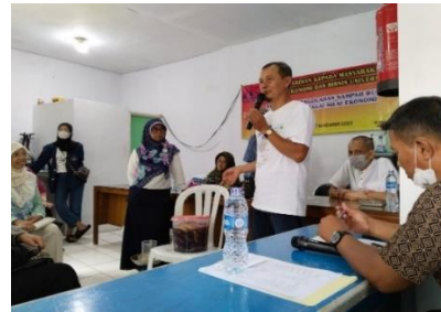
Gambar 5. Demonstrasi cara membuat ecoenzym