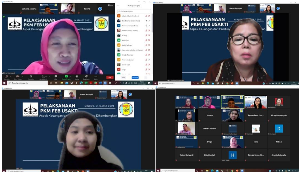
Gambar 2. Pelaksanaan Kegiatan

Peserta diberikan kuesioner sebelum kegiatan dilaksanakan dengan tujuan untuk mengukur tingkat pengetahuan para peserta mengenai sumber pendanaan usaha dan penyusunan laporan keuangan yang efektif sebelum pemaparan materi. Materi dipaparkan melalui media Zoom dan dijelaskan serta diberikan contoh soal. Kegiatan PkM ini memberikan informasi, pengetahuan dan keterampilan dalam sumber pendanaan bisnis dan pengelolaan keuangan. Setelah materi diberikan, kuesioner kembali diberikan kepada para peserta untuk mengetahui keberhasilan dari kegiatan ini. Apakah pengetahuan peserta meningkat dengan adanya kegiatan ini atau tidak. Capaian keberhasilan kegiatan dapat dilihat pada Tabel 2.