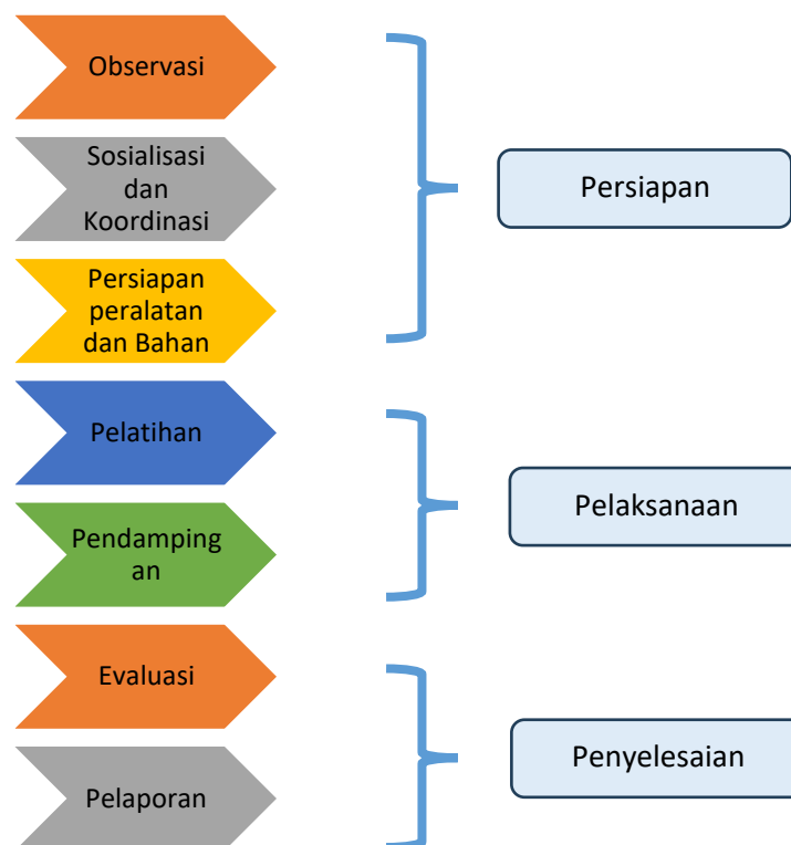
Gambar 3. Diagram Alir Pelaksanaan

Program Pengabdian kepada Masyarakat ini dirancang dengan pendekatan partisipatif, sehingga mitra tidak hanya berperan sebagai penerima manfaat tetapi juga terlibat aktif dalam keseluruhan proses. Mitra utama adalah Pusat Pelatihan dan Pengembangan Pendidikan Jakarta Barat (P4 Jakbar), yang menaungi guru-guru SMK dari berbagai jurusan, termasuk akuntansi.