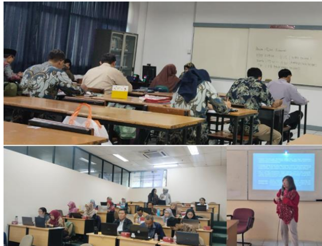
Gambar 2. Foto Kegiatan

dampak positif dalam hal pengelolaan kelas yang lebih efektif dan interaksi yang lebih intensif antara fasilitator dengan peserta.